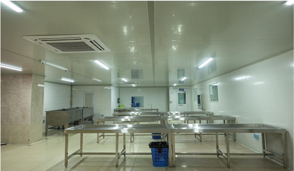
Khu sơ chế nguyên liệu