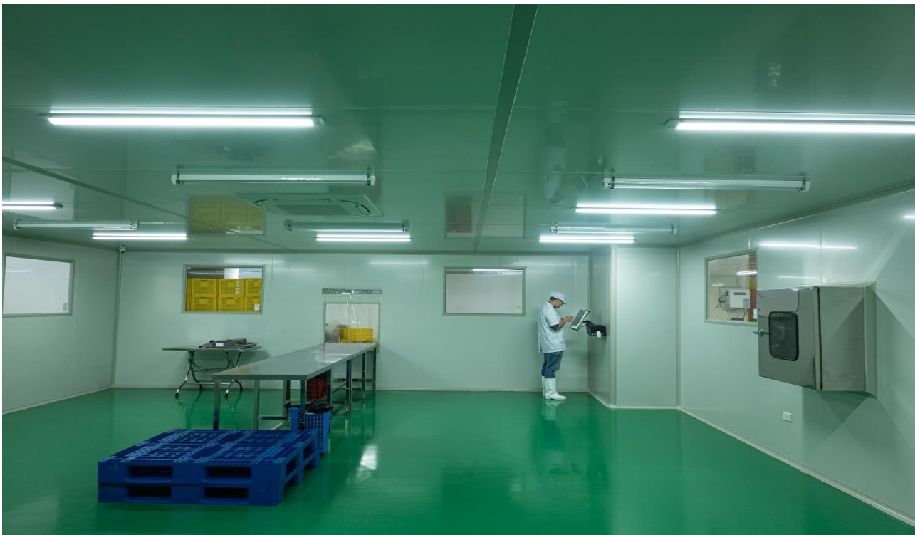
Khu đóng gói