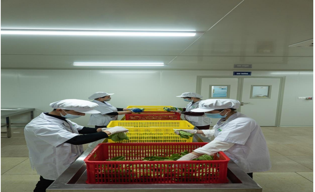
Công nhân đang sơ chế nguyên liệu